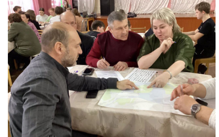
Картирование на семинаре

Проектный семинар. Дата проведения – 25.03.23. На семинаре жители г. Сим: • Сформулировали историческое значение и актуальную роль территории проекта для города в целом и для себя лично; • Охарактеризовали состояние и основные проблемы территории; • Определили сценарии использования территории проекта на текущий момент; • Выразили пожелания относительно параметров благоустройства территории; В семинаре приняли участие 40 человек. Число команд – 5