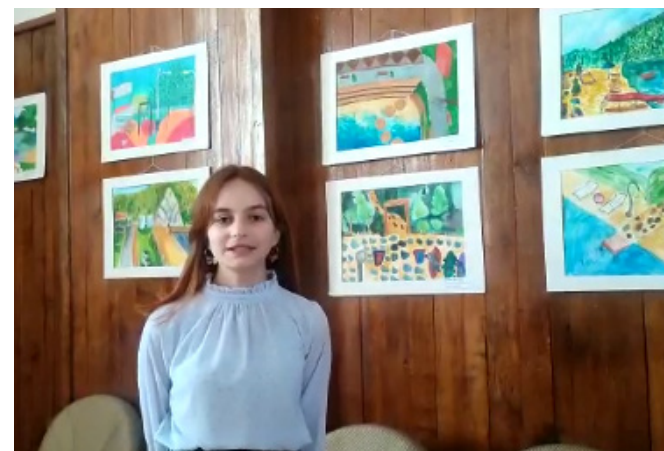
Конкурс детских рисунков

Обсуждение возможностей благоустройства территории проекта обсуждалось с представителями различных городских сообществ. Число фокус-групп – 9 Численность участников – 113