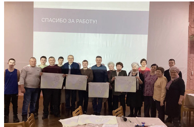
Общегородской проектный семинар 1

Проектный семинар. Дата проведения – 16.03.23. На семинаре жители г. Сим: • Сформулировали историческое значение и актуальную роль территории проекта для города в целом и для себя лично; • Охарактеризовали состояние и основные проблемы территории; • Определили сценарии использования территории проекта на текущий момент; • Выразили пожелания относительно параметров благоустройства территории; В семинаре приняли участие 52 человека. Число команд – 7