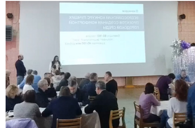
Общегородской проектный семинар 2

Проектный семинар. Дата проведения – 16.03.23. На семинаре жители г. Сим: • Сформулировали историческое значение и актуальную роль территории проекта для города в целом и для себя лично; • Охарактеризовали состояние и основные проблемы территории; • Определили сценарии использования территории проекта на текущий момент; • Выразили пожелания относительно параметров благоустройства территории; В семинаре приняли участие 52 человека. Число команд – 7