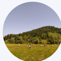
Игра в футбол

Проектным бюро ИсаевАрхитект, по заказу Администрации Симского городского поселения, при участии Регионального центра компетенции Челябинской области, в 2023 году была подготовлена заявка на участие во всероссийском конкурсе "Лучших проектов комфортной городской среды в малых городах и исторических поселениях". Заявка дошла до финала, но к сожалению, не оказалась в числе победителей".